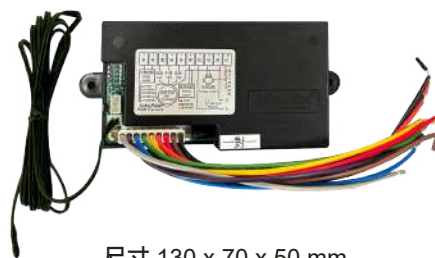
尺寸 130 x 70 x 50 mm

移動式感溫SENSOR 及紅外線接收器 1.2公尺長可置於回風口 或其他適合位置控制盒。