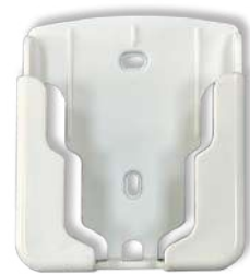
遙控器座 尺寸 76 x 63 x 23 mm