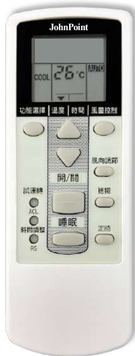
遙控器 尺寸 150 x 56 x 18 mm